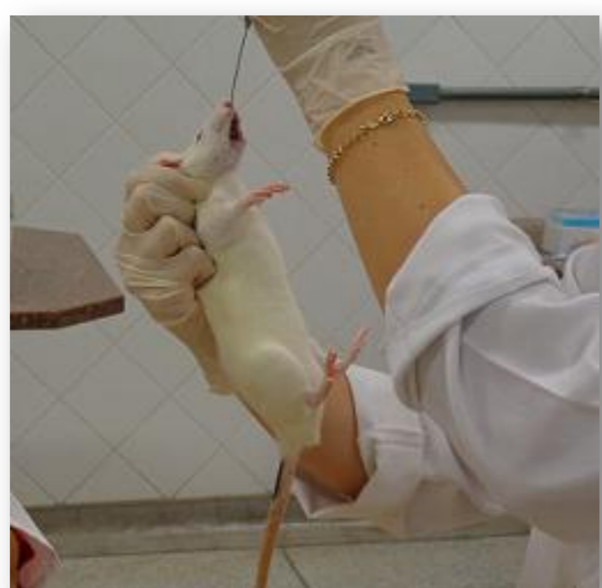
Figura 2- Administração de glicose