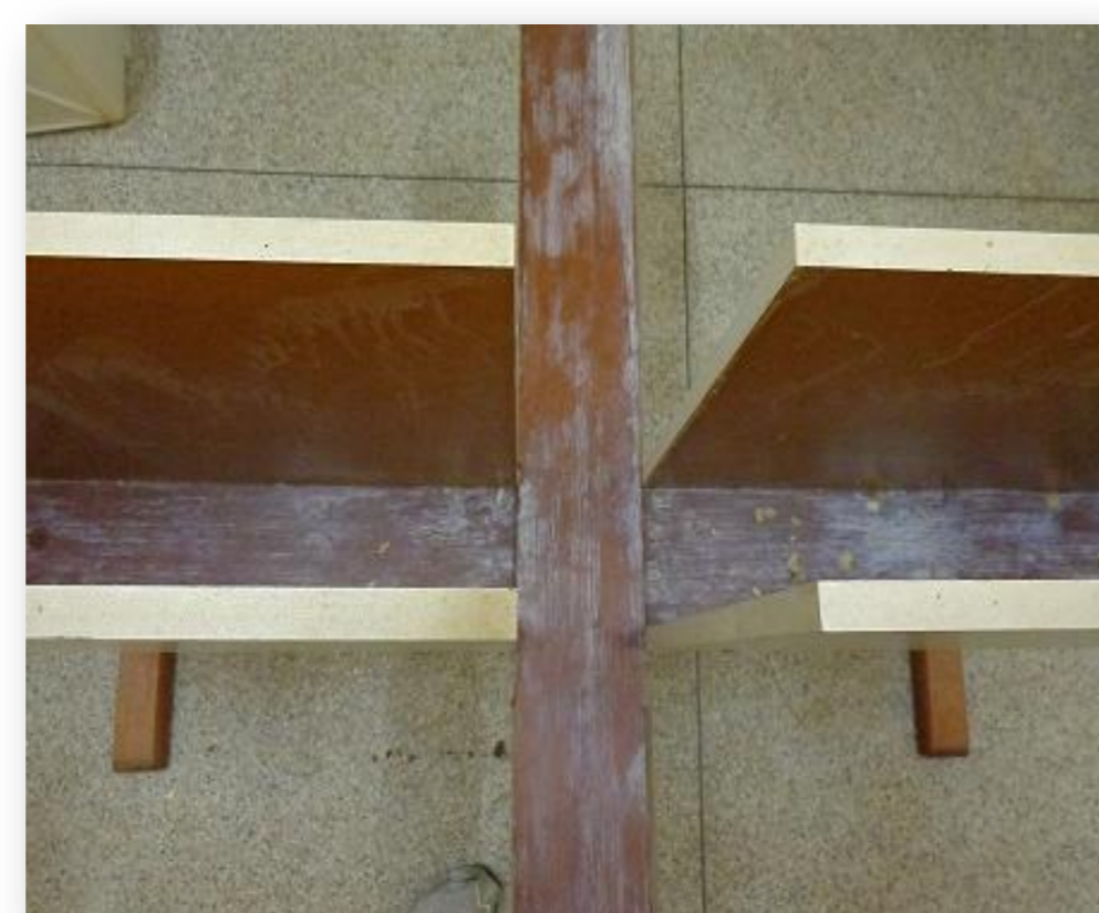
Figura 6- Labirinto em Cruz Elevado