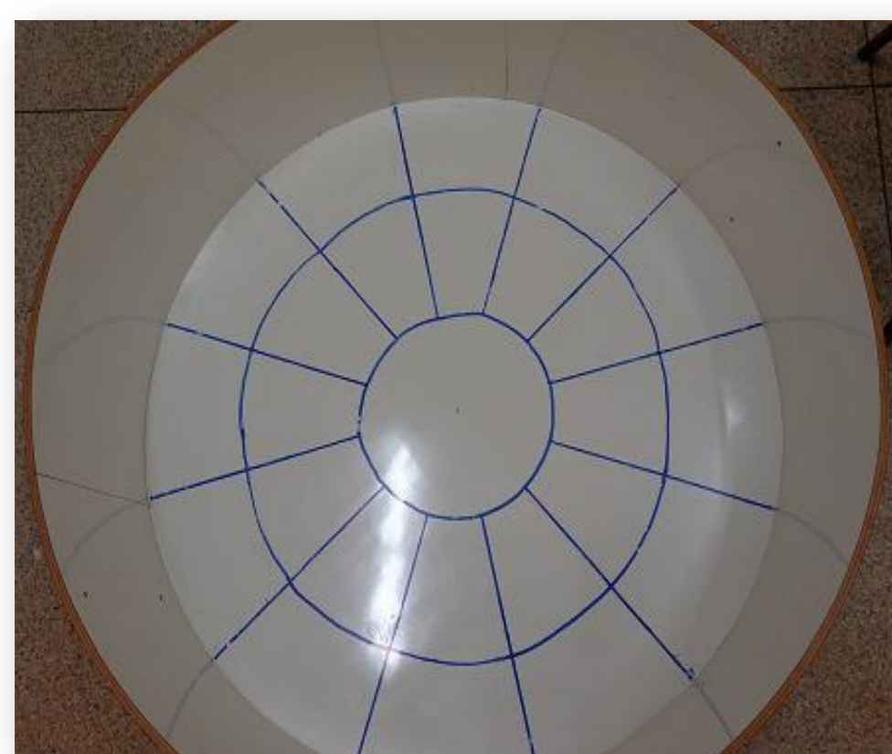
Figura 4- Arena de Campo Aberto