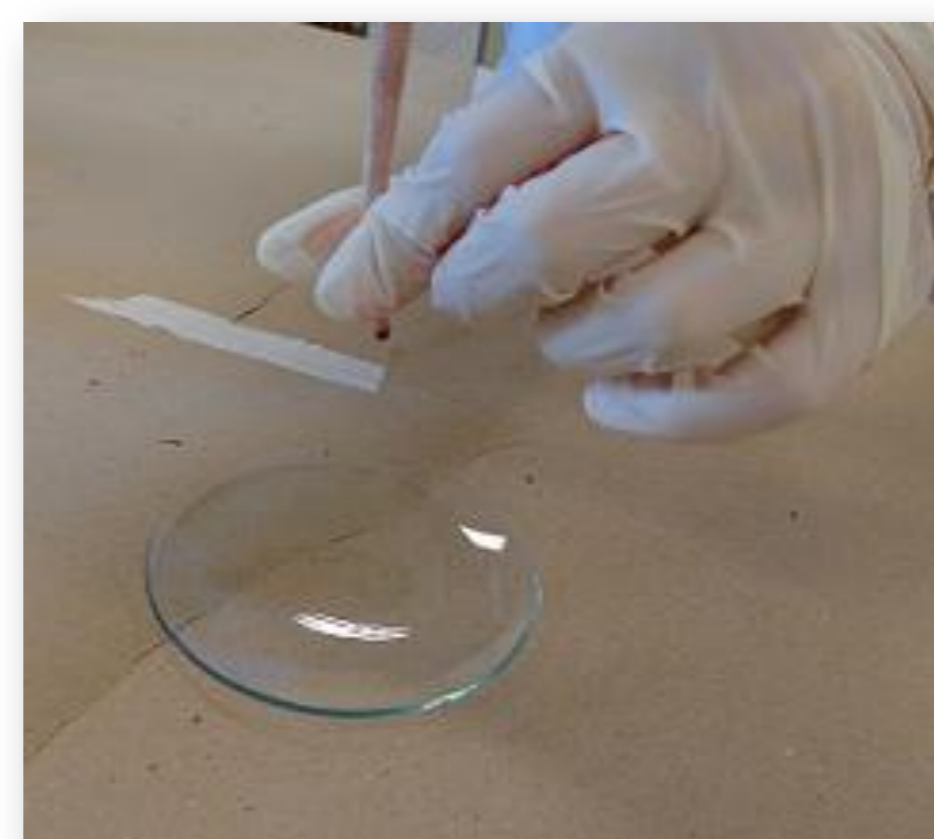
Figura 3- Coleta de sangue