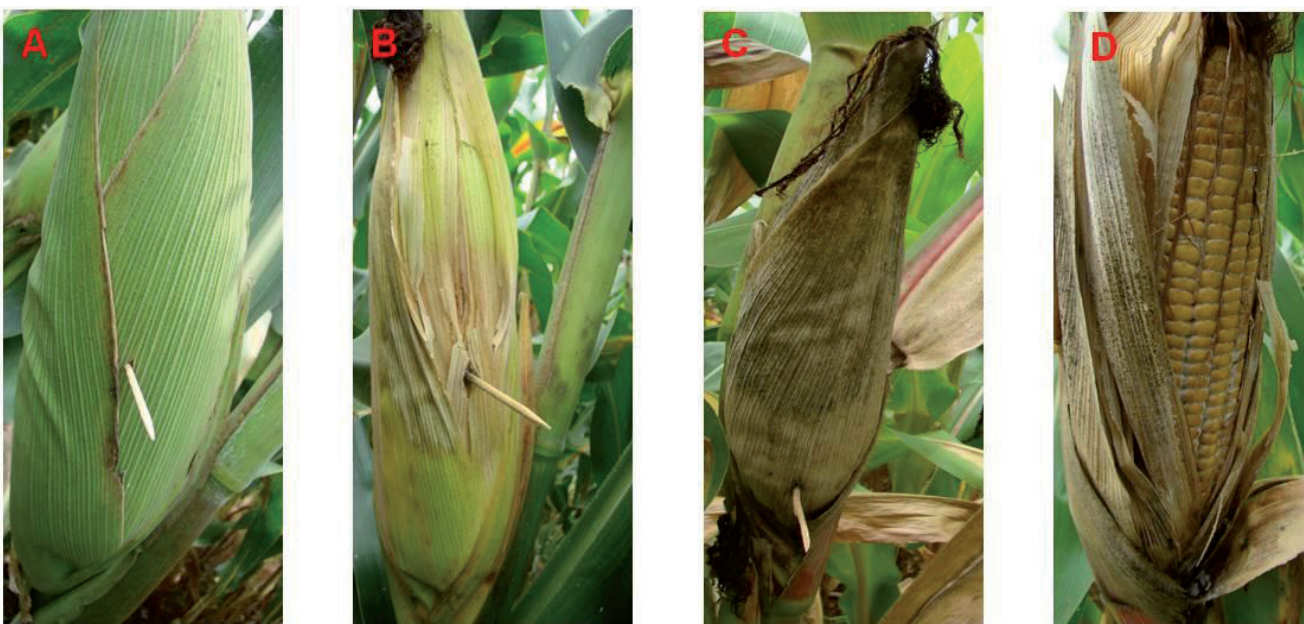
Figura 1. Evolução dos sintomas da podridão-branca-da-espiga inoculada com palito de dente imerso em solução de esporos. A- espiga logo após a inserção do palito com inóculo. B- início do desenvolvimento dos sintomas. C- espigas completamente colonizadas pelo patógeno, D- detalhe dos sintomas nos grãos com presença de picnídios e micélio branco do patógeno.

A época de inoculação influenciou na eficiência do método de inoculação (Figura 2). As inoculações realizadas mais cedo, nas fases em R2 e R3, resultaram em sintomas mais severos da podridão-branca-da-espiga (Figura 2a e 2b). As inoculações realizadas nessas duas fases resultaram em incidência de 100% de grãos ardidos. As inoculações realizadas na fase R4 também resultaram em alta incidência de grãos ardidos, no entanto, não se observou presença do micélio branco do patógeno nas espigas (Figura 2c).