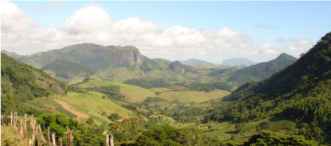
Figura 2. Uma bacia hidrográfica com limites bem definidos – Bacia do Pito Aceso, Bom Jardim/RJ.