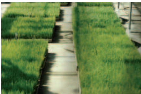
Fig. 3. Caixa com mudas prontas para transplante. Embrapa Clima Temperado, Pelotas, RS, 2011.

Após a semeadura, as caixas são irrigadas normalmente, empilhadas a uma altura de 10 a 15 caixas e cobertas com uma lona plástica preta, de preferência à sombra, por um período de dois a quatro dias, ou até que se processe a emergência das plântulas. Ocorrida a emergência, as caixas são distribuídas em um viveiro, tendo-se o cuidado de não deixá-las em contato direto com o piso (Figura 3). Nestas condições, as caixas permanecem no viveiro, recebendo irrigação diária, até que as mudas estejam num estágio ideal para transplante.