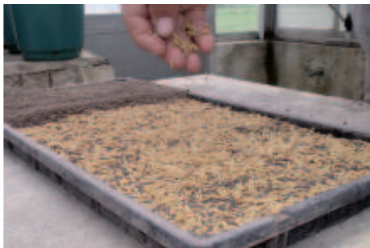
Fig. 2. Preparo das caixas para produção de mudas. Embrapa Clima Temperado, Pelotas, RS, 2011.

Para a semeadura, coloca-se nas caixas uma folha de jornal para evitar o entrelaçamento das raízes das plântulas com as perfurações das caixas. A seguir, adiciona-se uma camada de solo de aproximadamente 3 cm, sobre a qual são semeados cerca de 200 g de semente, com percentagem de germinação superior a 80%, cobertas com uma camada de 1 cm de solo (Figura 2). Recomenda-se que o solo seja arenoso-argiloso, finamente peneirado e livre de sementes invasoras. Com relação às sementes, sugere-se que sejam tratadas com fungicidas, evitando assim possíveis moléstias no viveiro.