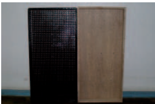
Fig.1. Caixas para produção de mudas de arroz. Embrapa Clima Temperado, Pelotas, RS, 2011.

As mudas são produzidas em caixas de madeira ou de plástico, com fundo perfurado, e com dimensões de 60 cm de comprimento, 30 cm de largura e 5 cm de altura (Figura 1). Utiliza-se, aproximadamente, 120 a 140 caixas por hectare.