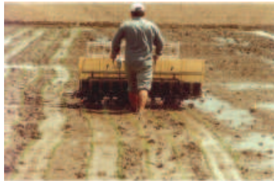
Fig. 5. Transplante mecanizado de mudas de arroz. Embrapa Clima Temperado, Pelotas, RS, 2011.

As máquinas utilizadas permitem o transplante de três a oito mudas por cova, com espaçamento de 12 a 22 cm entre covas e 30 cm entre linhas. Estas máquinas possuem dois pontos de regulagem de plantio: a distância entre covas e o número de mudas por cova. Também permitem regular a profundidade de plantio. O rendimento médio de uma transplantadora de seis linhas é de 0,3 ha/hora. São necessárias em torno de 120 caixas de mudas para o transplante de 1 hectare, o que implica um gasto de 30 a 35 kg de sementes, dependendo da cultivar.