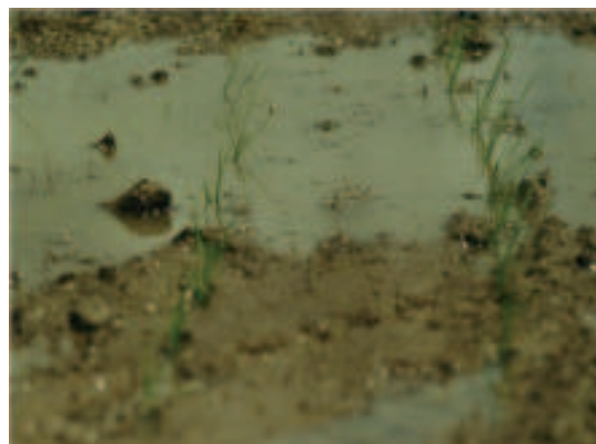
Fig. 6. Mudas de arroz após dez dias do transplante. Embrapa Clima Temperado, Pelotas, RS, 2011.

Após o transplante recomenda-se manter o solo saturado, porém sem lâmina de água por um período de dois a três dias. Este processo tem a finalidade de permitir a melhor fixação da muda (Figura 6). Posteriormente, deve-se colocar uma lâmina de água suficiente para cobrir a superfície do solo, podendo mantê-la até o final do ciclo da cultura. Caso ocorra reinfestação de invasoras, o controle deve seguir as recomendações dos órgãos de pesquisa (REUNIÃO, 2010). Entre cinco e sete dias após o transplante, recomenda-se uma aplicação de nitrogênio de 50% da recomendação técnica. Logo após o transplante, a planta inicia a renovação do sistema radicular. A partir deste momento o manejo da cultura segue as recomendações técnicas da pesquisa (REUNIÃO, 2010).