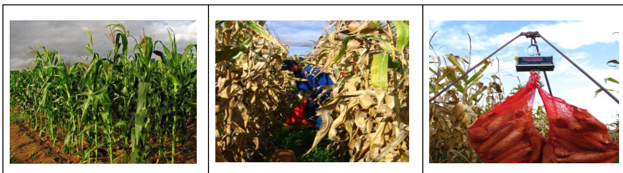
a) Visão geral do experimento; b) colheita das espigas por parcela útil; c) Pesagem das espigas de milho.

A calagem do solo foi realizada três meses antes do plantio, baseada em análise prévia de solo coletado a uma profundidade de 0 -20 cm. Foram adicionadas 2,5 toneladas de calcário dolomítico por hectare, distribuído com trator e calcareadeira. O solo foi preparado com arado e grade (plantio convencional) e os tratamentos foram distribuídos manualmente e incorporados com um trator com grade. Como a variação do tamanho das sementes dos genótipos de milhos crioulos é grande foi utilizado uma semeadora manual (saraquá) para fazer a semeadura. Foi aplicada adubação de cobertura (0.080 toneladas por ha de uréia) após 30 dias da emergência. De acordo com a necessidade, o experimento foi irrigado por aspersão usando canhões. Ao final do desenvolvimento da cultura, as espigas de milho foram colhidas, identificadas, pesadas em balança digital, secas à 65°C e debulhadas.. A umidade dos grãos foi corrigida para 13%.