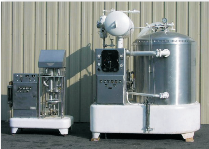
Figura 1. Carbo-Coller.

É o proporcionador (Figura 1) que prepara a bebida para o enchimento; é ele que irá combinar o xarope composto, a água tratada e o gás carbônico nas proporções corretas e transferir a bebida final misturada para a enchedora.