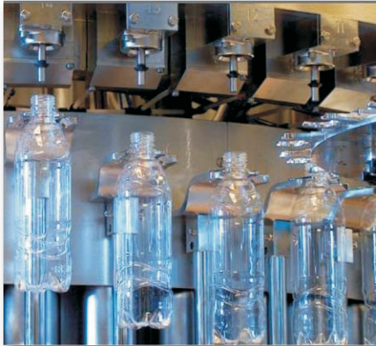
Figura 2. Garrafas PET entrando na enchedora.

A enchedora (Figura 2) recebe a embalagem limpa e enche com a bebida até o nível correto, transferindo automaticamente a embalagem para encapsuladora (colocação da tampa de fechamento) e, por último, para fechamento. Esse processo deve ser realizado suavemente, sem produção de espuma.