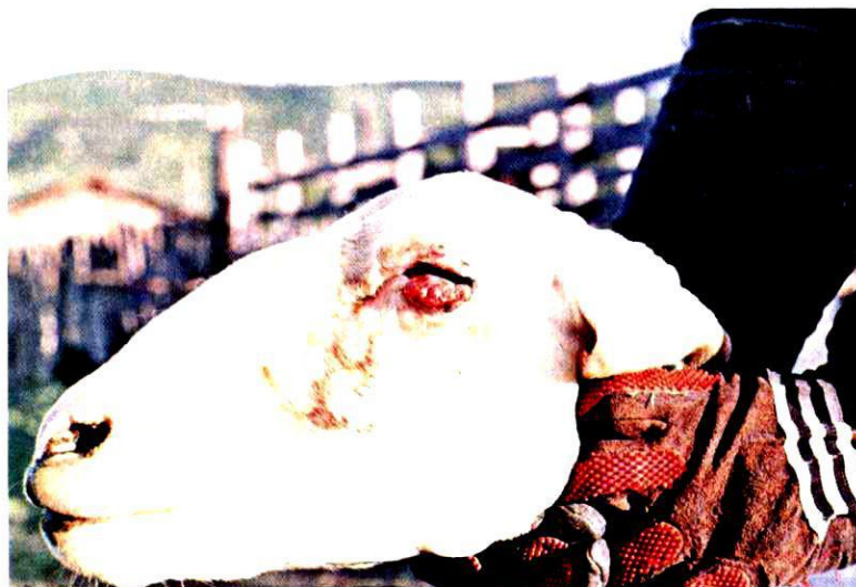
G. 3. Ovino, raça Santa Inês, pele e pelagem branca, apresentando tumor na pálpebra inferior.