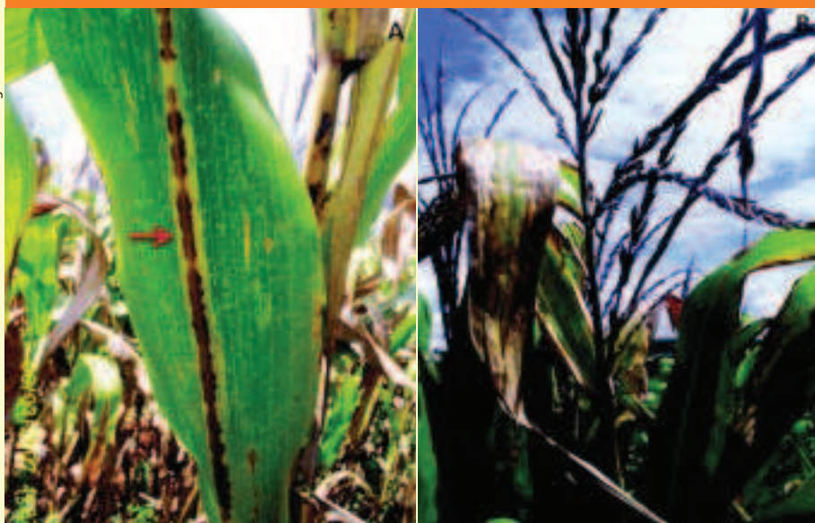
A) Severa seca do ponteiro de plantas de milho com destaque às extensas lesões na nervura. B) Sintoma típico da seca de ponteiro em plantas de milho

mais secas no início do ciclo da cultura, o que resulta em menor solubilidade e oferta dos nutrientes para as plantas, tornando-as mais vulneráveis à doença. Após a polinização, temperaturas elevadas entre 28°C e 30°C e alta umidade favorecem esses patógenos. A podridão seca por M. phaseolina é agravada por temperaturas acima de 32°C e estiagem durante o período de enchimento de grãos. Elevadas temperaturas do ar e do solo, associadas a extensos períodos de alta umidade relativa e nebulosidade, favorecem a podridão causada por C. graminicola . As podridões bacterianas são auxiliadas por elevada precipitação, encharcamento do solo, baixa circulação de ar e temperaturas entre 30°C e 35°C. Segundo resultados da Embrapa Milho e Sorgo, a incidência de podridões de colmo causadas por C. graminicola , Fusarium spp. e D. macrospora é maior no plantio de verão quando comparado ao plantio de segunda época (Figura 2).