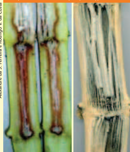
Podridão do colmo de milho causada por Fusarium spp. (esq.) e detalhe da podridão de colmo causada por Diplodia spp. (dir.).

Não existe uma medida única recomendada para o controle das podridões de colmo em milho. Para se obter sucesso no manejo dessa doença um conjunto de alternativas devem ser executadas de forma integrada. A primeira e, talvez, a mais importante, é a escolha correta da cultivar. Nesse caso, deve ser dada preferência para híbridos que apresentem, além de alta produtividade, satisfatória resistência no colmo. Resultados obtidos pela Embrapa Milho e Sorgo demonstram a existência de variabilidade quanto à resistência à