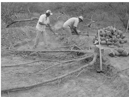
Figura 1. Remoção do solo para retirada de xilopódios no imbuzeiro. Petrolina, PE. Embrapa Semi-Árido, 2005.

Na Figura 1, pode-se observar o processo de retirada dos xilopódios nas plantas de imbuzeiro após a eliminação da copa.