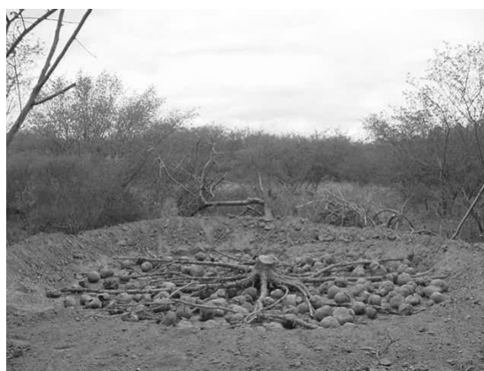
Figura 3. Características do sistema radicular do imbuzeiro com os xilopódios após a remoção do solo. Petrolina, PE. Embrapa Semi-Árido, 2005.

as secundárias e estas mais que as terciárias e assim sucessivamente. Os xilopódios são encontrados, principalmente nas raízes secundárias e terciárias. As raízes de maior comprimento horizontal apresentaram até 18,59 m com diâmetro variando de 16,7 cm próximo ao tronco e 0,23 cm nas extremidades. Todavia, nestas raízes não foram encontrados xilopódios na parte que ultrapassou a projeção da copa das plantas. A maior concentração de xilopódios ocorre próximo ao tronco das plantas num raio de 1,5 m de diâmetro. Fora da projeção da copa, poucas túberas foram encontradas. Em termos de profundidade, as raízes concentraram-se nos primeiros 100 cm de solo com variação de 58 a 136 cm de profundidade em algumas plantas.