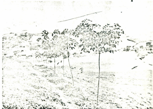
Clone IAN 873