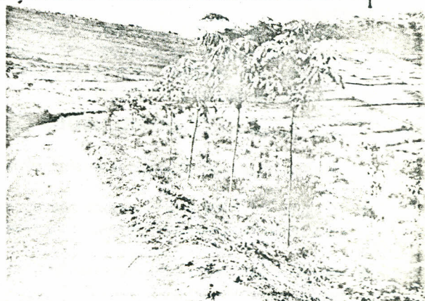
Clone Fx 2261

Também observaram-se a ocorrência de pragas e doenças e o aparecimento de deficiências nutricionais.