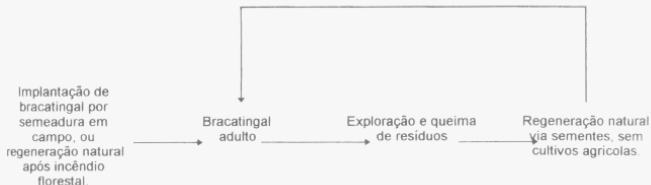
FIGURA 2. Sistema florestal tradicional de cultivo da bracatinga (SFT)

O SFT é uma variação do SAFT, sendo caracterizada pela ausência da cultura agrícola na fase inicial da regeneração natural (Figura 2). Os bracatingais resultantes são muito densos. Embora não haja dados comparativos com rendimento do SAFT, pressupõe-se que a ausência da fase agrícola resulta em produtividade menor, pelo acirramento da competição. O SFT é praticado em propriedades agrícolas (por motivos como mão-de-obra, terrenos muito íngremes, falta de orientação técnica, etc.) e em talhões grandes em propriedades extensas pertencentes à indústrias consumidoras de lenha.