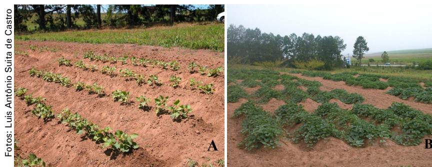
Figura 2. Plantio (A) e desenvolvimento (B) das plantas de batata-doce em condições de campo, sobre camaleões.

devem ser retiradas dos vasos onde ocorreu o desenvolvimento inicial, fazendo-se a poda das raízes enveloadas que se formaram na base, caso contrário ocorrerá menor formação de batatas ou batatas mais alongadas. Após colocada a muda na cova, com uma enxada ou com as mãos, adiciona-se terra até a cobertura total do sistema radicular. É recomendável fazer o plantio nas horas mais amenas do dia, pois temperaturas altas podem ocasionar danos à muda. Após o plantio, o solo deve ser umedecido, para facilitar o pegamento das plantas.