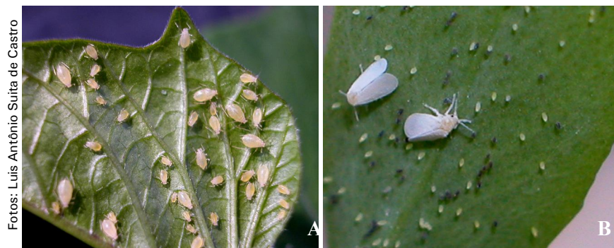
Figura 3. Pulgões (afídeos) (A) e mosca-branca ( Bemisia tabaci ) (B), transmissores de viroses em plantas de batata-doce.