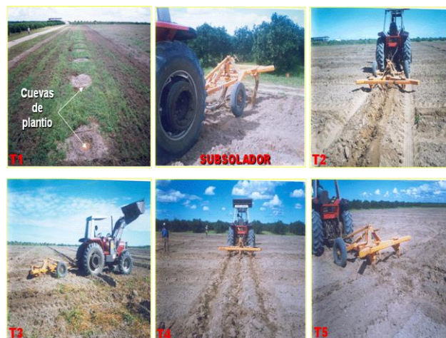
Figura 2. Tratamentos de preparo do solo: 1- aração + gradagem (convencional); 2 - subsolagem com uma haste nas linhas de plantio; 3 - subsolagem cruzada, com uma haste, nas linhas de plantio; 4 - subsolagem com três hastes (haste central na linha de plantio); 5 - subsolagem cruzada, com três hastes (haste central na linha de plantio).