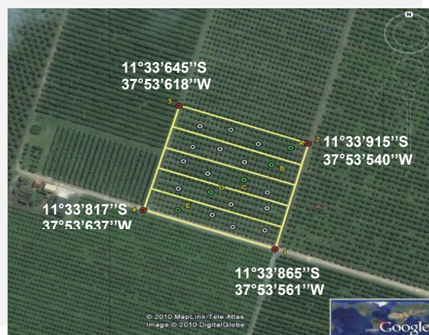
Figura 1. Pomares cítricos na Fazenda Lagoa do Coco, destacando-se a área experimental, georreferenciada, com as parcelas (retângulos) e trincheiras (círculos) onde foram coletadas as amostras de solo para análise.