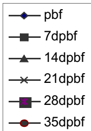
FIG. 1. Curvas de regressão para altura de plantas quando do surgimento dos primeiros botões floral (PBF) e aos 7, 14, 21, 28 e 35 dias após (dpbf). Dourados, MS, 2006.