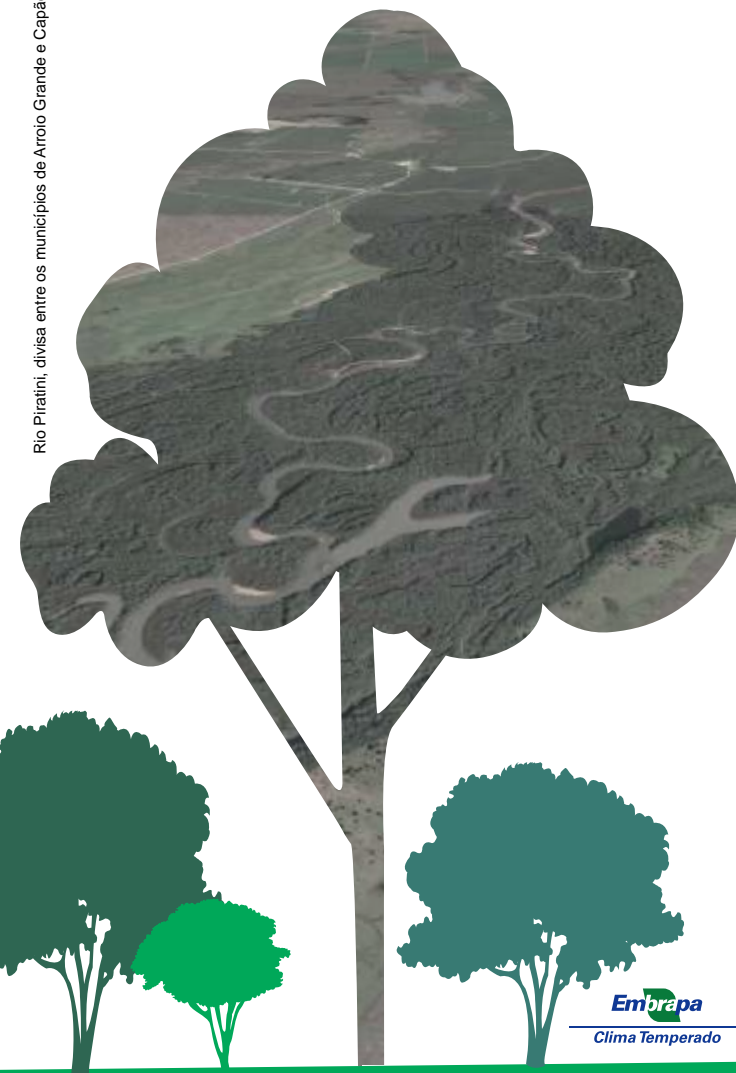
Rio Piratini, divisa entre os municípios de Arroio Grande e Capão do Leão.