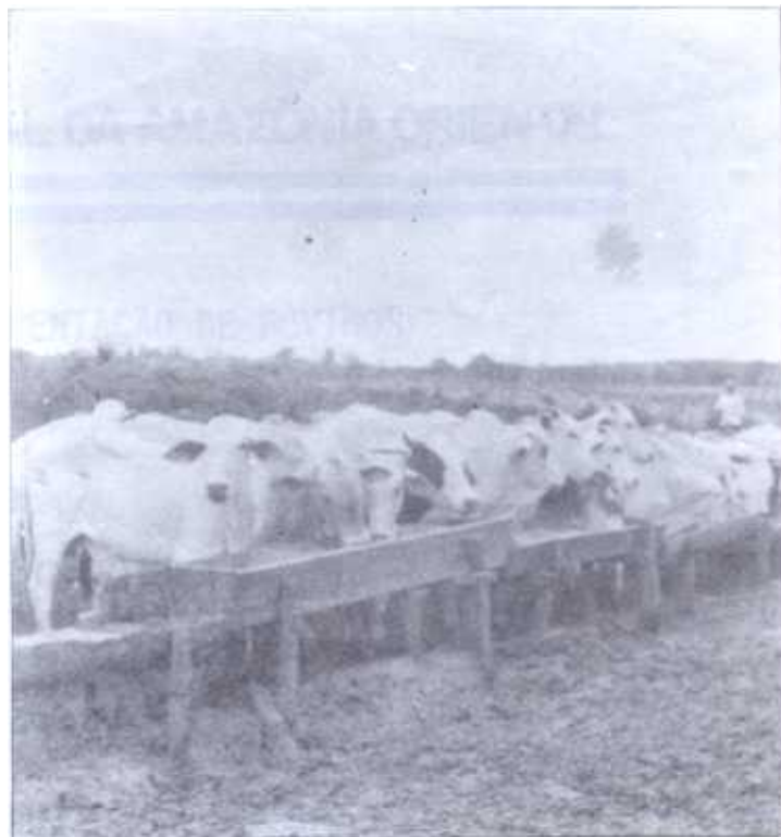
FIG. 3. Bovinos de corte suplementados com ração contendo 35% de cama de aviários.

como suplementação alimentar (3 kg/animal/dia) ao pastejo em quicuío-da-amazônia ( Brachiaria humidicola ), sob taxa de lotação de 1,5 animal/hectare, durante 180 dias (junho a dezembro), possibilita ganho de peso médio de cerca de 0,850 kg/animal/dia.