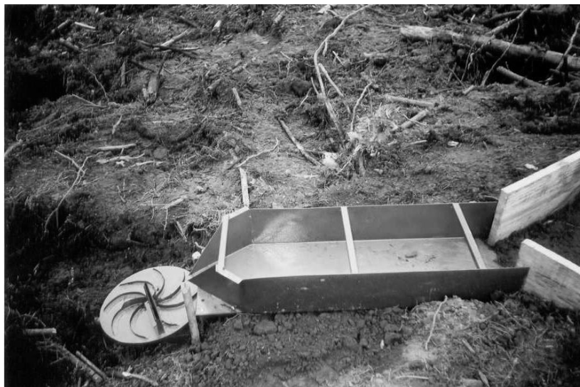
Figura 2. Detalhes da calha coletora de enxurrada Coshocton , no momento da implantação do projeto. Figure 2. Details of Coshocton runoff samplers, in the time of project implantation.

A determinação analítica dos sedimentos retidos nas calhas coletoras se deu através de pesagem