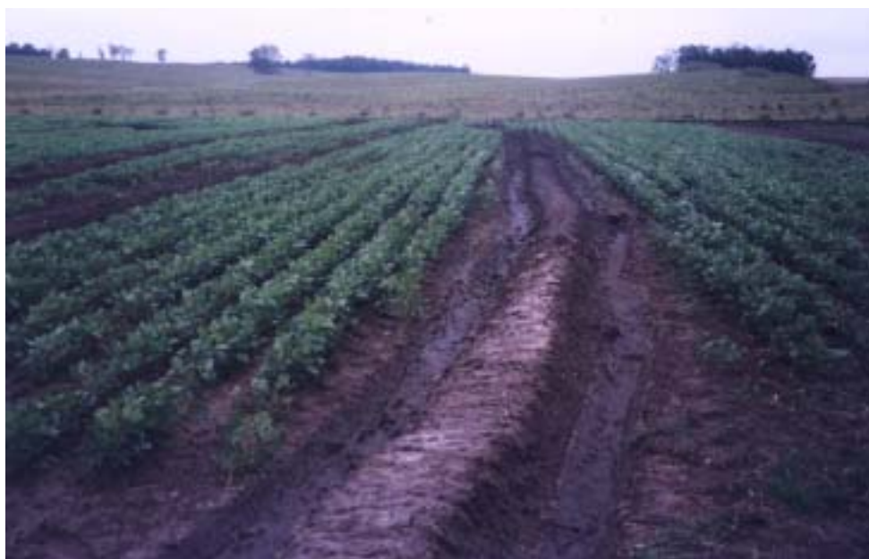
Fig. 5. Lavoura de soja irrigada por inundação intermitente. Aplicação da lâmina de água (a) e esgotamento da água dos quadros (b). Bagé, RS, 2000.