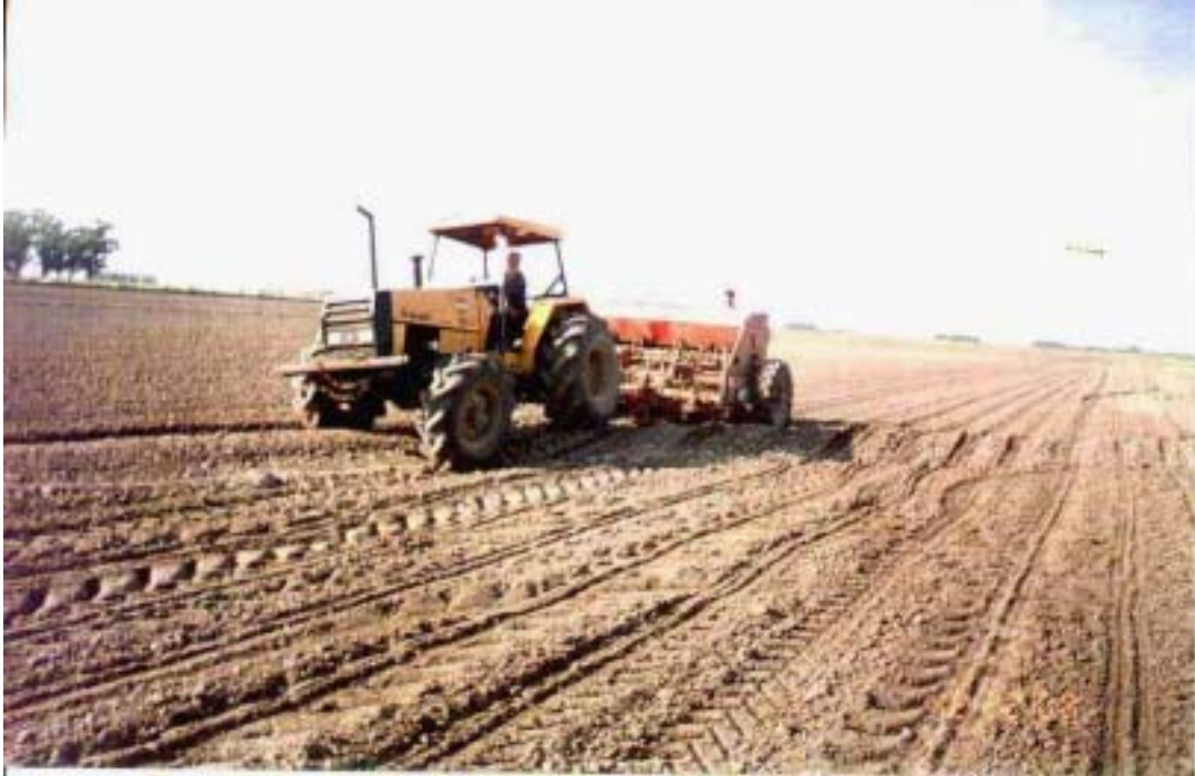
Fig. 4. Semeadura sobre taipa em lavoura de soja a ser irrigada por inundação intermitente. Embrapa Clima Temperado, 2000.

Na irrigação por inundação das culturas de soja, milho e sorgo, a água deve permanecer no quadro da lavoura somente o tempo suficiente para enchê-lo, esgotando-o imediatamente. O solo não deve permanecer saturado por mais de dois dias. Portanto, a irrigação não deve provocar o molhamento de todo o perfil do solo para que, após a retirada da lâmina de água, possa ocorrer uma redistribuição da umidade da camada superficial saturada para as camadas inferiores do solo (Figuras 5a e 5b). A execução da irrigação, para atender a estas condições, depende do tipo de solo, da declividade do terreno, do tamanho dos quadros da lavoura, do número de entradas e saídas de água, da vazão utilizada, de um sistema de macro drenagem bem dimensionado e da experiência do aguador. Dados de lavouras de soja