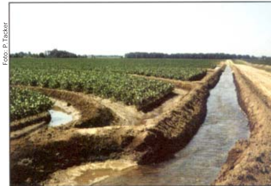
Fig. 2. Lavoura de soja irrigada por inundação intermitente com múltiplas entradas de água. Stuttgart, AR, USA. 2000.