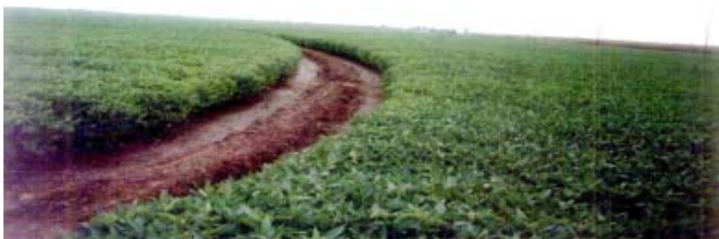
Fig. 3. Lavoura de milho (a) e de soja (b), irrigadas por inundação intermitente, com taipas construídas após a semeadura. São Lourenço do Sul, RS, 1999 e Stuttgart, AR, USA, 2001, respectivamente.