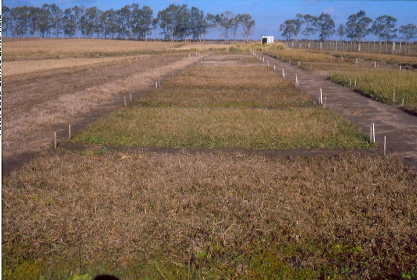
Figura 3. P. modestum BRA-009831 (na segunda parcela) mostrando menor sensibilidade que os demais P. modestum às 12 primeiras geadas formadas na estação fria. Data: 10 de junho de 1988.

Segundo o aspecto das plantas, as observações feitas durante o inverno são a seguir resumidas (Tabela 3). Convém salientar que até meados de julho de 1988 foram registradas 24 geadas, em um ano com inverno muito frio.