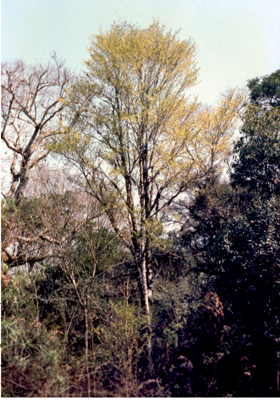
Irati, PR (Colégio Florestal)