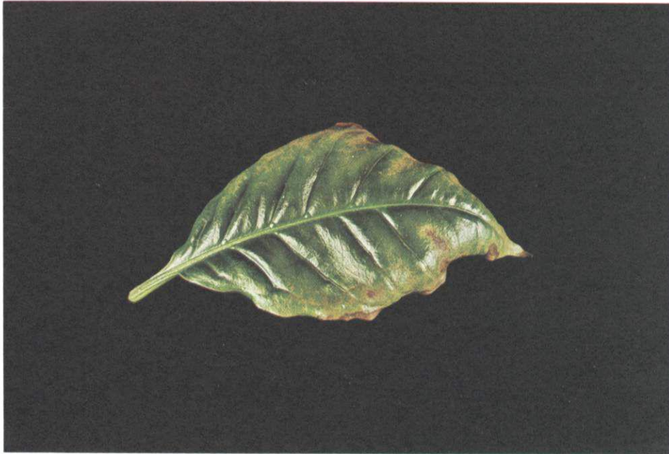
FIG. 3. Sintomas da toxidez de Al em folhas jovens de cafeeiros; folhas pequenas, apresentando clorose e alguns pontos necróticos ao longo da margem e com um aspecto de enrolamento.