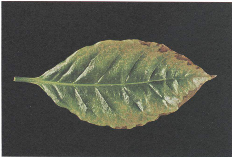
FIG. 4. Sintomas da toxidez de Al em folhas de cafeeiros localizada na parte média dos galhos produtivos; clorose e pontos necróticos iniciando na margem e progredindo para o interior do limbo da folha.