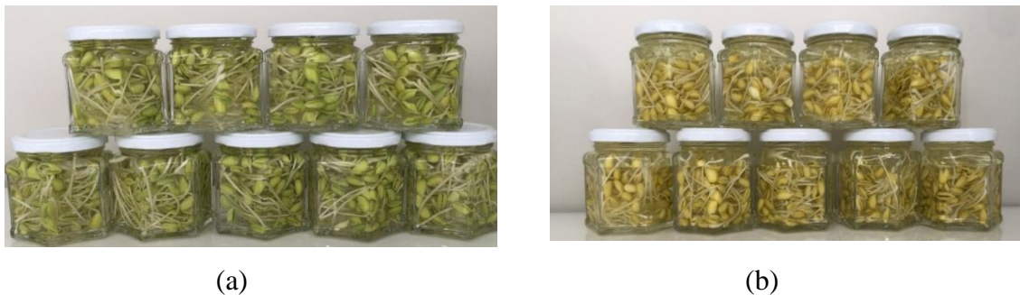
Figura 1. Brotos de soja em conserva antes (a) e após (b) a pasteurização.

Os valores de umidade dos brotos em conserva liofilizados no tempo inicial e após 6 meses de armazenamento foram padronizados em 5,80% e 5,62% (extrato seco de 94,20% e 94,38%), respectivamente, para as análises de proteínas, lipídeos, cinzas inibidor de tripsina Kunitz, ácido fítico e minerais. Na Tabela 1 estão apresentados os teores de umidade, pH, sólidos solúveis, proteína, minerais, lipídeos, ácido fítico, atividade do inibidor de tripsina Kunitz, atividade ureática, componentes minerais dos brotos em conserva. Observou-se, ao analisar o teor de umidade, dos brotos em conserva no tempo inicial e 6 meses armazenados não apresentaram diferença, os teores de umidade encontrados foram 84,32% e 84,98%, respectivamente. Porém comparando com o broto in natura apresentaram diferenças, sendo que o teor de umidade encontrado nos brotos in natura foi 82,58%. Esta diferença entre brotos in natura e em conserva pode ser explicada, pois após o acondicionamento e processamento ocorre o estabelecimento do equilíbrio dinâmico entre os brotos e a salmoura já que a água é um dos componentes mais abundantes em hortaliças (Teruel, 2008).