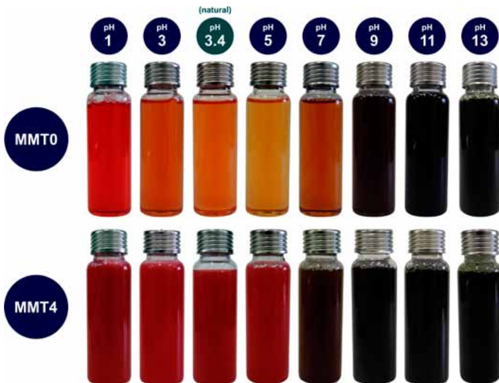
Figura 2. Variações de cor de MMT0 e MMT4 em função de alterações do pH (sendo 3,4 o pH natural do suco).