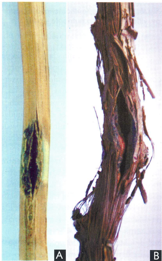
Fig. 4. Cancrios em ramos maduros (A) e no tronco (B) de plantas da variedade Red Globe naturalmente infectadas em campo com o cancro-bacteriano, causado por Xanthomonas campestris pv. viticola .

Em ramos verdes e maduros, há o desenvolvimento de cancrios, com fendilimentos longitudinais e coloração negra que, com o agravamento da infecção, gradualmente, alargam-se expondo os tecidos internos (Fig. 4A e 4B). Nesses cancrios, a bactéria permanece latente e inerte durante o período seco do ano e, com a ocorrência de chuvas, verifica-se abundante exsudação. A infecção pode atingir o sistema vascular da planta, tornando-se sistêmica. Em corte longitudinal de ramos infectados, principalmente próximo aos cancrios, constata-se a presença de descoloração vascular, em uma pequena extensão.