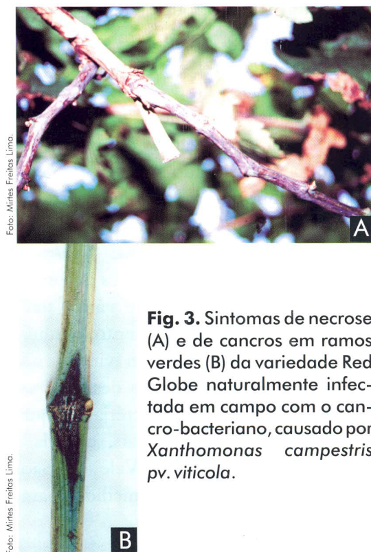
Fig. 3. Sintomas de necrose (A) e de cancrios em ramos verdes (B) da variedade Red Globe naturalmente infectada em campo com o cancro-bacteriano, causado por Xanthomonas campestris pv. viticola .

Em ramos verdes, surgem estrias e/ou manchas escuras irregulares, cujas áreas, mais tarde, tornam-se necróticas (Fig. 3A e 3B).