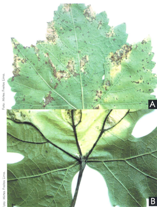
Fig. 1. Sintomas de manchas angulares (A) e lesão setorial (B) em folhas da variedade Red Globe naturalmente infectada em campo com o cancro-bacteriano, causado por Xanthomonas campestris pv. viticola .

Nas folhas há o surgimento de pequenas manchas angulares escuras (1 a 2 mm de diâmetro), circundadas ou não por halo amarelado, distribuídas na folha, entre as nervuras (Fig. 1A). Essas manchas, quando coalescem, causam crestamento e morte de grandes áreas da folha. Ainda nas folhas, são observadas manchas necróticas setoriais, de cor parda (Fig. 1B).