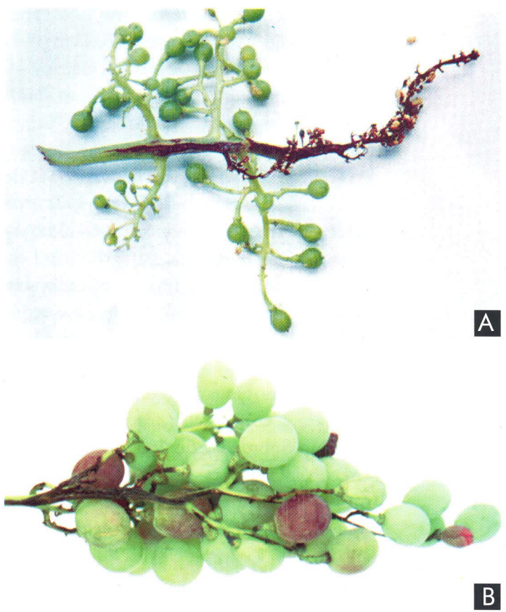
Fig. 5. Sintomas de necrose em inflorescência (A) e de cancrios na ráquis (B) de cacho da variedade Red Globe naturalmente infectada em campo com o cancro-bacteriano, causado por Xanthomonas campestris pv. viticola

ramos, com a presença de manchas escuras e a formação de cancrios (Fig. 5B). Em bagas, podem ocorrer lesões escuras e levemente arredondadas. Em cachos já formados, há murcha de bagas, após necrose da ráquis e dos pedicelos. O ataque da doença é mais intenso nos frutos, quando a infecção ocorre no início da frutificação, e os sintomas são constatados na extremidade dos cachos ou no ponto de inserção do pedúnculo no ramo.