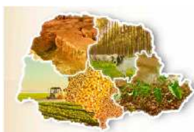
Figura 1. Unidades de Mapeamentos de Solos na Microbacia de Arroio Fundo – Distrito de Margarida, Mal. Cândido Rondon – PR.