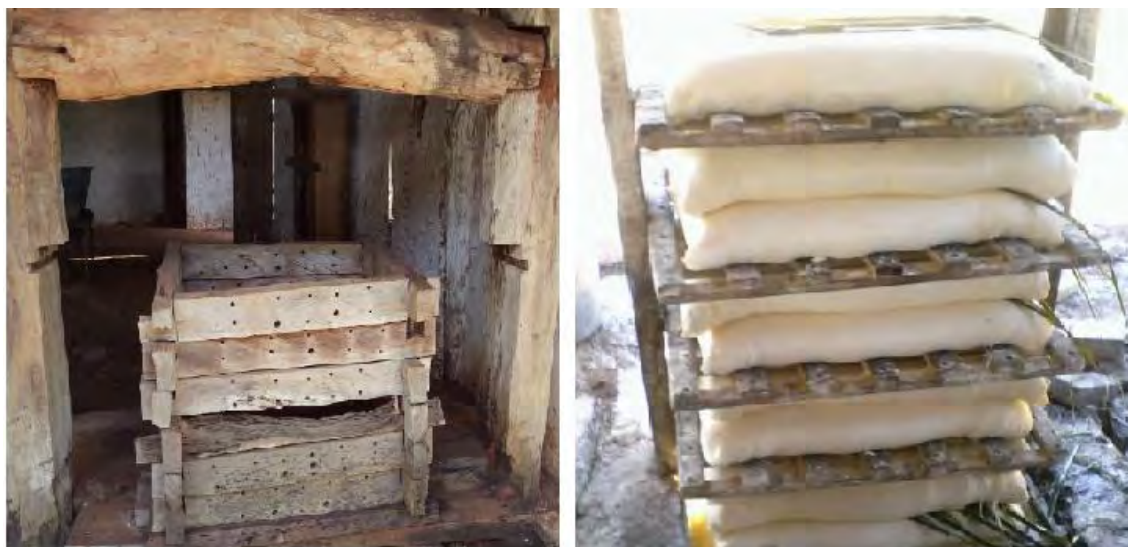
Figura 2. Equipamentos utilizados para produção de farinha de mandioca na Baixada Cuiabana – Mato Grosso.

Os insumos para o processamento da mandioca em farinha são basicamente a água, a lenha e uma fonte de energia para os motores. A lenha utilizada para torrar a farinha é retirada da própria comunidade ou seu entorno. Quanto à água utilizada no beneficiamento, na maioria das vezes, provém de poços e nascentes e é armazenada em caixas. Em alguns casos, a água é coletada diretamente dos rios. A falta de água é um dos problemas relatados pelos agricultores, sendo que esse fator decisivo para desativar algumas farinheiras.