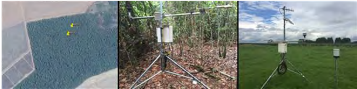
Figura 2. Estações microclimáticas instaladas no interior do fragmento florestal e estação meteorológica automática principal (pleno sol) da Embrapa Agrossilvipastoril, Sinop, MT.