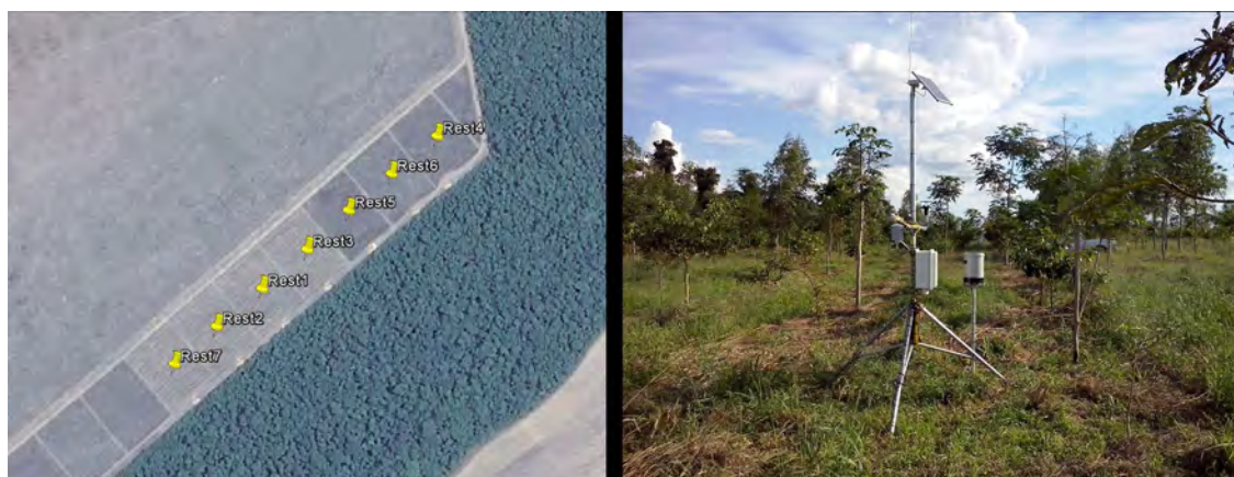
Figura 1. Estações microclimáticas instaladas no experimento de restauração florestal de Reserva Legal da Embrapa Agrossilvipastoril, Sinop, MT.

Para estudar as modificações microclimáticas nos sete tratamentos de recomposição de RL, foram instaladas sete estações no centro de cada tratamento no bloco 3 do experimento, denominadas Rest1, Rest2, Rest3, Rest4, Rest5, Rest6 e Rest7, mensurando: radiação solar fotossinteticamente ativa (RFA), radiação solar global (Rg), saldo de radiação (Rn), temperatura do ar (T), umidade relativa do ar (UR), velocidade do vento (V), precipitação acumulada (P), duração do período de molhamento foliar (DPM), fluxo de calor no solo (FCS) e temperatura do solo (TS). A avaliação das variáveis microclimáticas é contínua, visando à caracterização do microclima em diferentes condições ambientais às quais o experimento é submetido. Para isso, são utilizados sensores específicos acoplados a sistemas automáticos de aquisição de dados (“datalogger”) programados para leituras a cada 5 s e obtenção dos valores médios e totais a cada 15 min, além dos valores horários e diários (Figura 1).