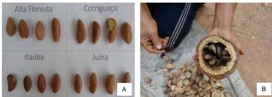
Figura 1. Castanhas coletadas em alguns municípios de Mato Grosso (A). Disposição das castanhas dentro do ouriço (B).