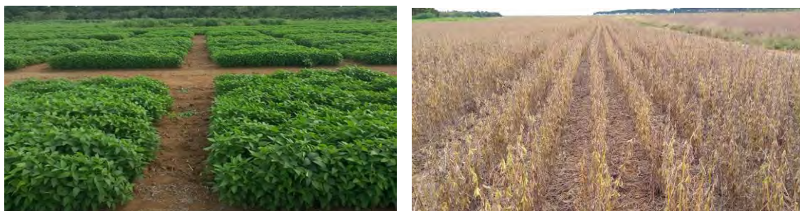
Figura 1. Experimento com fertilizantes na cultura da soja em Sinop, MT.

Em 26/10/2016 foi semeada soja para avaliação de quatro fertilizantes fosfatados, pelo projeto “Rede nacional de experimentos de campo para avaliação agrônômica e validação de novos fertilizantes e insumos biológicos”, liderado pela pesquisadora Maria da Conceição Santana Carvalho, da Embrapa Arroz e Feijão (Figura 1). Foram aplicadas doses de 0 kg ha -1 , 36 kg ha -1 , 57 kg ha -1 , 94 kg ha -1 e 116 kg ha -1 de P 2 O 5 no sulco de plantio, na forma de fertilizantes fosfatados comerciais, com tecnologias para aumento da eficiência (recobrimento com S e/ou polímeros para liberação lenta) e também na forma de superfosfato triplo (tratamento referência). A colheita foi realizada em 21/02/2017.