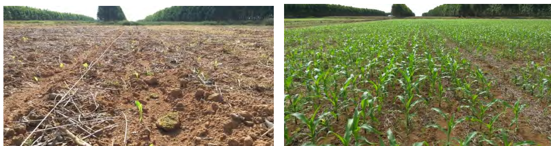
Figura 2. Experimento com fertilizantes na cultura do milho em Sinop, MT.

doses (0 kg ha -1 , 30 kg ha -1 , 45 kg ha -1 , 60 kg ha -1 e 90 kg ha -1 de P 2 O 5 ) no sulco de plantio. Nesse segundo experimento, não houve aplicação de P na soja cultivada anteriormente. A colheita foi realizada em 15/07/2015.