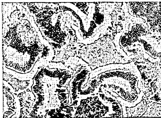
FIG. 2. Adenocarcinoma da região etmoidal (Suíno 137/70). Obj. 20. H.-E.