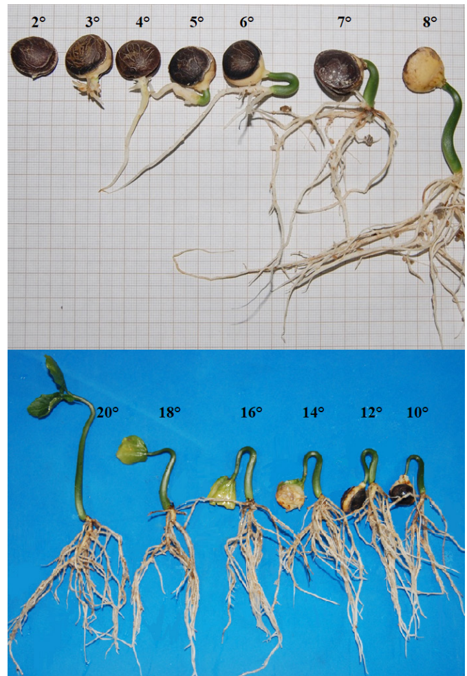
Figura 2. Aspecto morfológico da germinação de Plukenetia volubilis do 2° ao 20° dia de semeadura.

Quanto à biometria das sementes observou-se comprimento médio de 17,45 mm (variando de 13,28 a 20,30 mm), largura média de 15,05 mm (variando de 11,94 a 17,71 mm) e espessura média de 8,18 mm (variando de