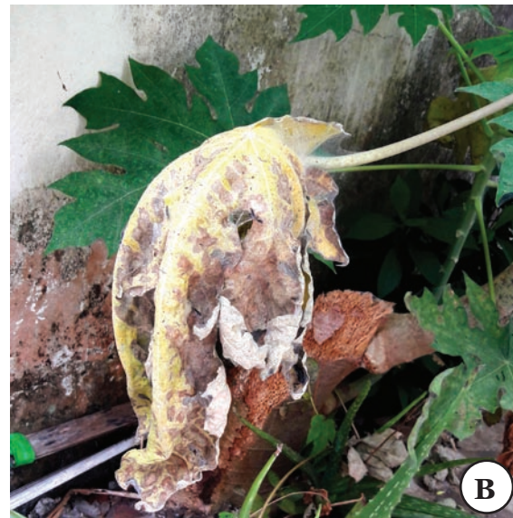
Figura 2. Presença de teia produzida por T. mexicanus em folha de mamoeiro (A). Folha de mamoeiro necrosada e morta pelo ataque de T. mexicanus (B).

Com relação à distribuição geográfica de T. mexicanus , a espécie já havia sido registrada nos estados da Bahia, Minas Gerais, Pernambuco, Paraíba, Rio Grande do Sul e São Paulo (FLECHTMANN & BAKER 1970; PASCHOAL 1970; MORAES 1981; MENDONÇA et al. 2011; ANDRADE-BERTOLO et al. 2013).