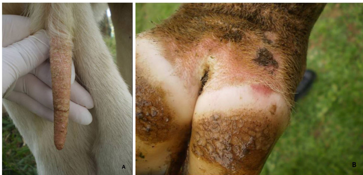
Fig.2. (A) Alopecia da extremidade da cauda do Bovino 3 submetido a intoxicação experimental por inflorescências de Sporobolus indicus infectadas por Bipolaris sp. Fissuras e crostas na extremidade distal. (B) Hiperemia na coroa do casco.

Em bovinos a hipertermia, taquicardia, taquipneia, hiperemia da coroa do casco e perda de pêlos da extremidade da cauda, causadas pela ingestão de sementes de S. indicus contaminadas por B. australis deve ser diferenciado de outras enfermidades. Dentre estas, podem ser citadas a intoxicação por C. purpurea (Belser-Ehrlich et al. 2013), cujos sinais clínicos e lesões são semelhantes; Neotyphodium coenophialum , um fungo endofítico que infecta festuca ( Festuca arundinacea ) onde causa hipertermia, baixo desenvolvimento, diminuição da produção de leite e do desempenho reprodutivo (Bhusari et al. 2007). Deve-se diferenciar também da intoxicação pelo cogumelo Ramaria flavo-brunnescens que pode causar entre outros sinais o desprendimento dos pêlos da extremidade da cauda, salivação, lesões necróticas da coroa do casco e perda de peso (Barros et al. 2006).