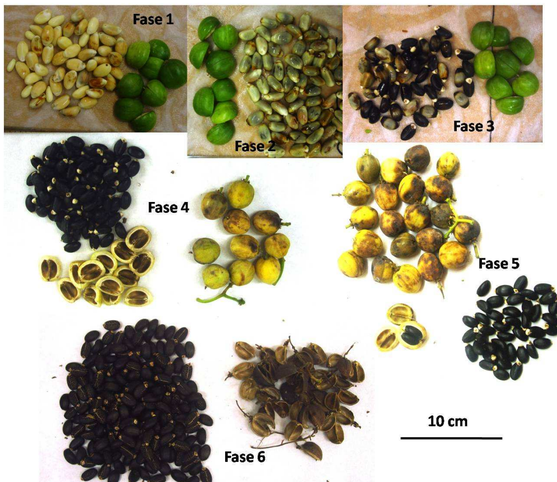
Figura 1. Fases de maturação de frutos de pinhão manso ( Jatropha curcas ).

proliferação de microrganismos. Por outro lado, na fase 6, as sementes apresentaram teor de água muito baixo e presença de inibidores da germinação o que acarretou em taxas mais baixas de germinação.