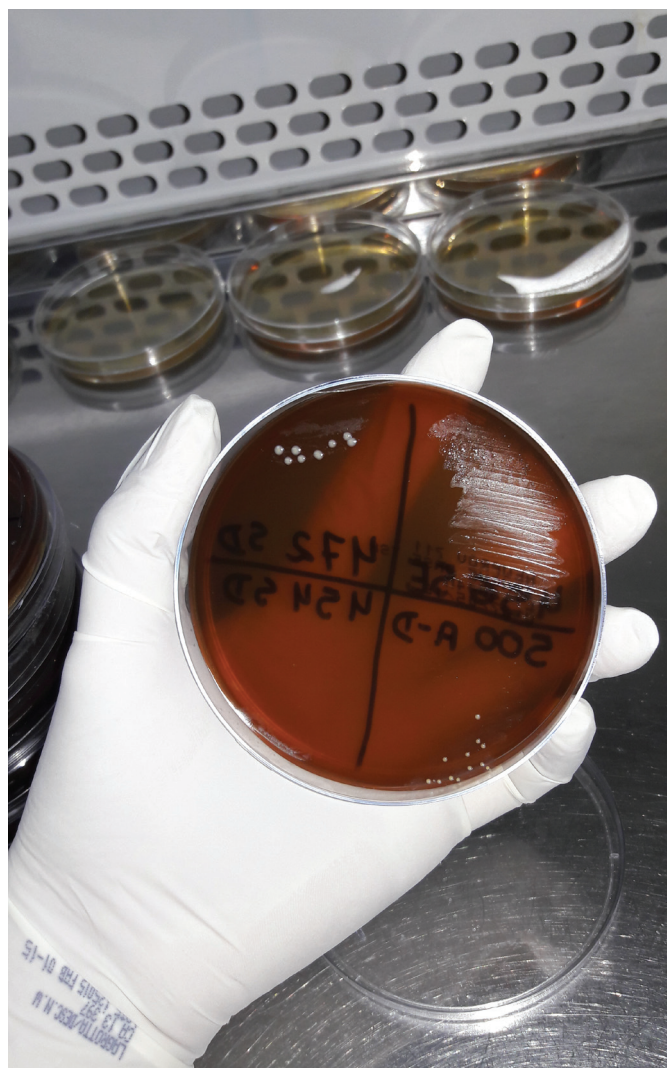
Figura 1. Colônias sugestivas de Staphylococcus spp.