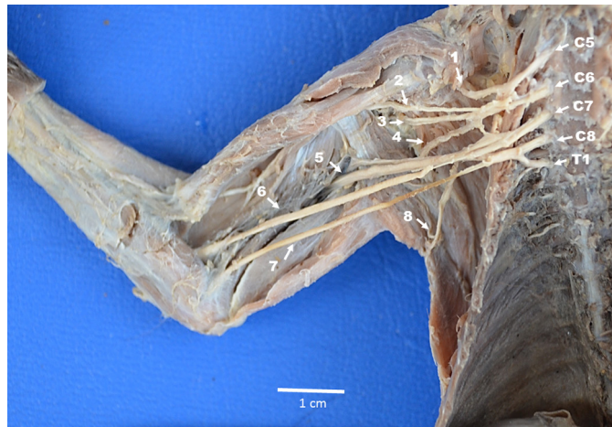
Fig.2. Vista ventral do plexo braquial do sagui-de-tufos-brancos ( Callithrix jacchus ). Nervo supraescapular (1), nervo musculocutâneo (2), nervo axilar (3), nervo subescapular (4), nervo radial (5), nervo mediano (6), nervos ulnar (7), nervo toracodorsal (8). Nervo cervical 5 (C5), nervo cervical 6 (C6), nervo cervical 7 (C7), nervo cervical 8 (C8), nervo torácico 1 (T1).