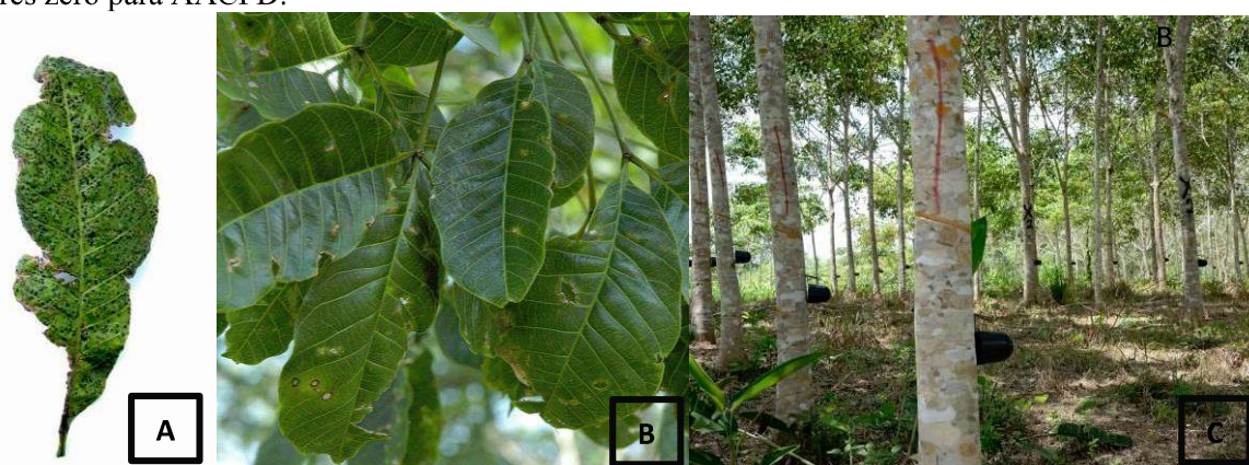
Figura 2. Foliolo do clone Fx3864 com sintomas e sinais de Microcyclus ulei (A) folhas do clone PMB01 com inexpressiva quantidade de estromas do patógeno (B) e árvores em parcela do clone FDR5788 (C), Bujari, AC.

Foi constatada a doença mal-das-folhas-da-seringueira, em todas as épocas de avaliação do experimento, com maior severidade na testemunha, clone Fx3864 (Fig. 2A). A severidade do mal-das-folhas-da-seringueira variou entre clones e entre as épocas de avaliação dentro de cada clone. Contudo a AACPD foi muito maior no clone Fx3864 do que nos outros clones. Os clones PMB01 (Fig. 2B), FDR5802, FDR5240, FDR5597, FDR5665, FDR5788 (Fig. 2C), CDC56 e MDF180 apresentaram valores zero para AACPD.