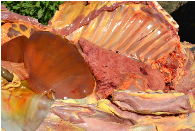
Fig. 2. Leptospirose em bezerros criados em resteva de arroz. Necropsia do Bezerro B. Cavernas torácica e abdominal com serosas ictericas, fígado alaranjado e hemorragias pulmonares multifocais.