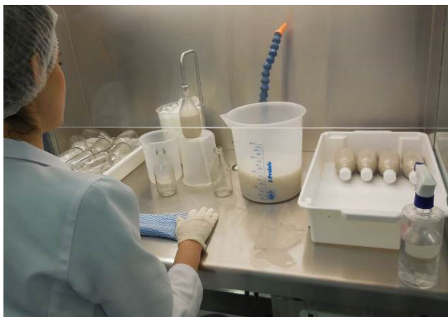
Figura 4. Envase do extrato de amêndoas de castanha-de-caju.