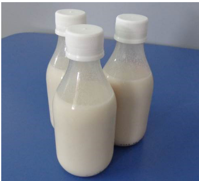
Figura 5. Extrato de amêndoas de castanha-de-caju envasado em garrafas de vidro.

As garrafas devem ser secas, rotuladas e, em seguida, armazenadas em temperatura ambiente (aproximadamente 28 °C). Nessas condições, o extrato apresenta vida de prateleira de pelo menos 4 meses (Figura 5).