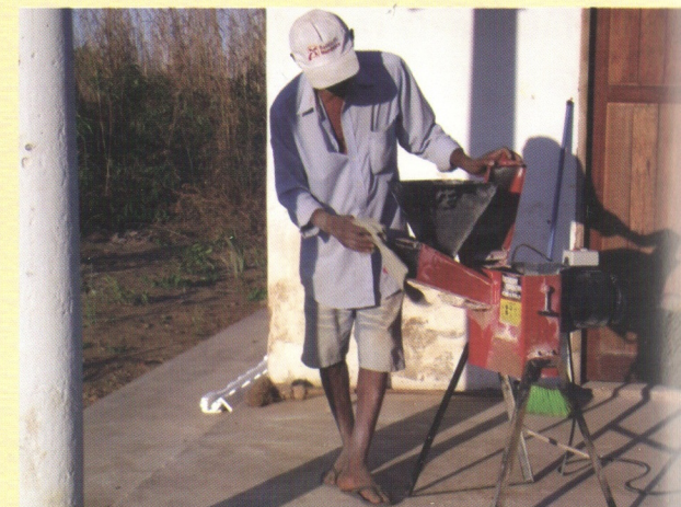
Triturador de ração, eixo direto, que pode ser guardado no depósito depois de cada utilização diária.

A produção diária é de 1.000 kg, ou mais, de misturas alimentares.