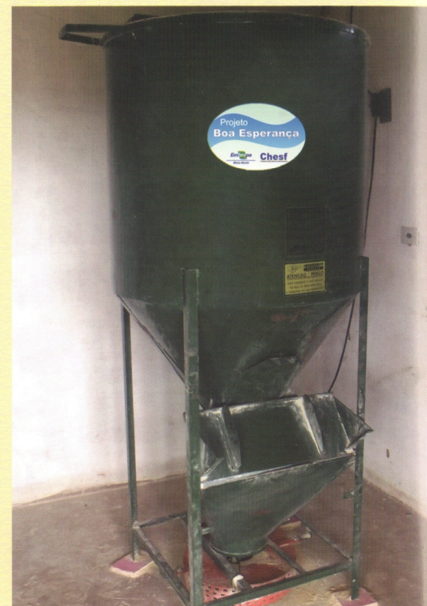
Misturador vertical, com capacidade de 300 kg.