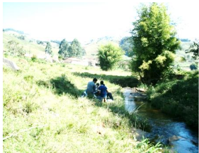
Pt. 7- Córrego Moreiras, Santa Rita do Ibitipoca

Figura 3: Fotografias de alguns pontos de amostragens apresentando a cobertura vegetal do entorno dos rios analisados conduzindo-nos a fazer reflexões sobre a vocação econômica da região e os impactos ambientais associados.