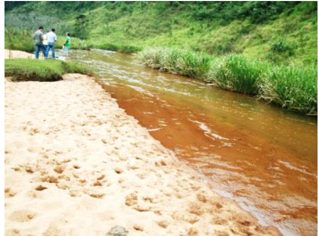
Pt. 5 Rio Grão Mogol, Lima Duarte