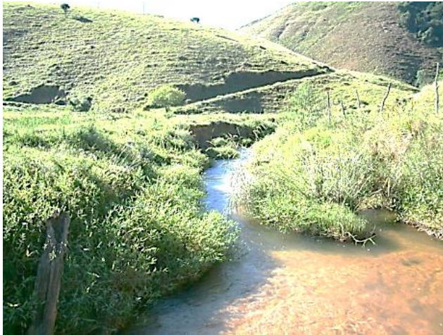
Pt.1 - Rio Grão Mogol, município de Lima Duarte

As bactérias do tipo Salmonellas também foram encontradas em mais da metade das amostras, sendo que em 9 das 15 amostras em que elas estiveram presentes o valor foi acima de 100 UFC/ML. Essas bactérias estão associadas a ocorrência de diversas doenças locais como gastroenterite, septicemia, febre entérica, dentre outras, que acometem a população em contato com a água. Diante disso, os riscos para a população mostram-se preocupantes, uma vez que os hospitais estão distantes das áreas rurais da região.