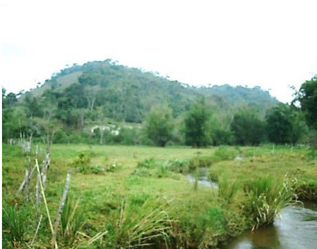
Pt. 6- Ribeirão Santo Antônio, município de Bias Fortes.