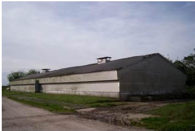
Figura 2. Aviário experimental do CAVG/IFSul

O experimento foi conduzido no Aviário Experimental do CAVG/IFSul (Figura 2), no período de 25 de julho a 17 de outubro de 2014, em um período experimental de 84 dias, divididos em quatro ciclos de 21 dias, utilizando-se na dieta incrementos crescentes de FPAM.