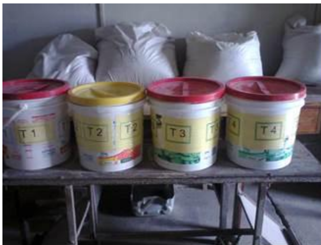
Figura 3. Rações experimentais