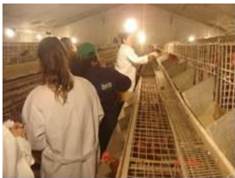
Figura 4. Manejo das aves para pesagem