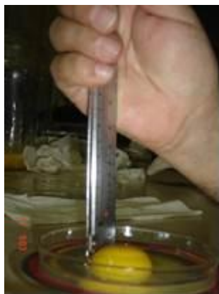
Figura 6. Avaliação da altura da clara

A altura da clara foi obtida com o uso de paquímetro analógico com precisão de 0,1 mm (vernier), posicionado junto a borda externa da gema do ovo e borda do albúmen espesso (Figura 6).