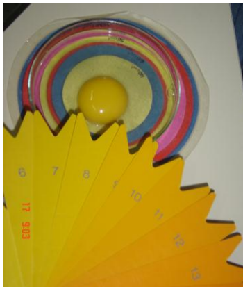
Figura 5. Avaliação da cor da gema

A cor da gema foi obtida através do uso do leque colorimétrico de Roche, (Figura 5) comparando-se visualmente a cor da gema com cada uma das 15 cores do leque, que variam em tonalidade de laranja claro (1) ao alaranjado escuro (15) (WILLIAMS, 1989; SANTOS, 2012).