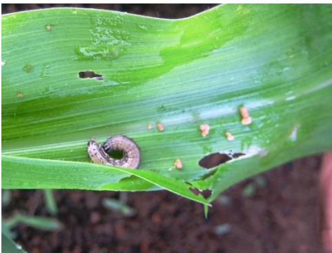
Figura 1. Spodoptera frugiperda e dano na folha de milho.

VTPROII(Cry1A.105 e Cry2Ab2), PowerCore(Cry1A.105,Cry2Ab2 e Cry1F) e Impacto Viptera(Vip3Aa2), expressando diferentes proteínas, suas respectivas isolinhas e suas isolinhas pulverizadas com inseticida químico. Foram realizadas duas amostragens no campo, sendo coletadas 25 plantas por parcela. Cada lagarta coletada ( Figura 1 ) foi individualizada em recipientes plásticos de 50ml com dieta artificial e criadas em laboratório, sendo observadas durante todo seu ciclo ou emergência de parasitoides ( Figura 2 ).