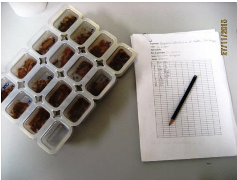
Figura 2. Monitoramento das lagartas coletadas.