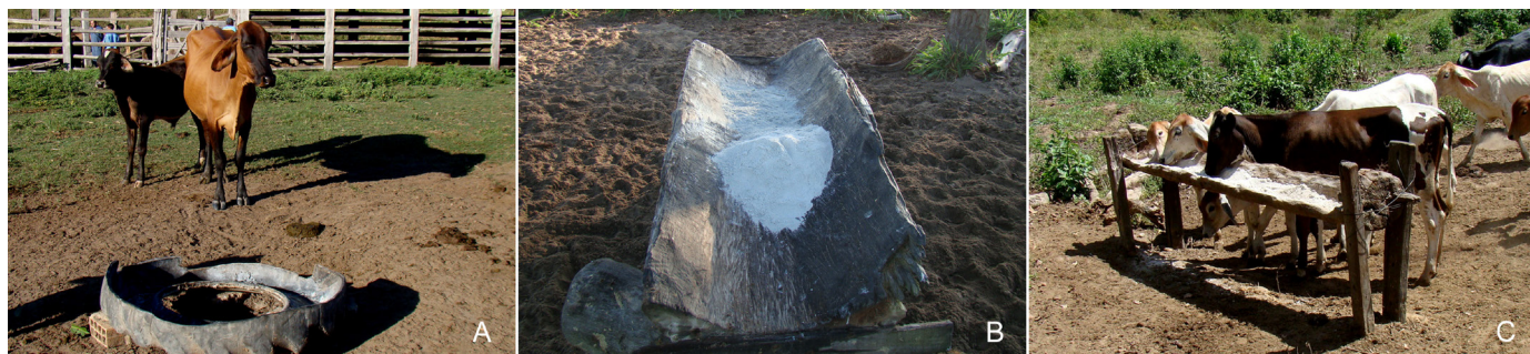
Fig.2. Cochos sem cobertura utilizados para a suplementação mineral de rebanhos bovinos da bacia leiteira do município de Rondon do Pará. (A) Cocho produzido de pneu de trator da Propriedade I, Abel Figueiredo, PA. (B) Cocho de madeira da Propriedade XI, Rondon do Pará, PA. (C) Cocho de madeira da Propriedade XII, Rondon do Pará, PA.

* Calcularam-se estas quantidades a partir das informações obtidas nos rótulos das embalagens das misturas minerais ofertadas aos animais.