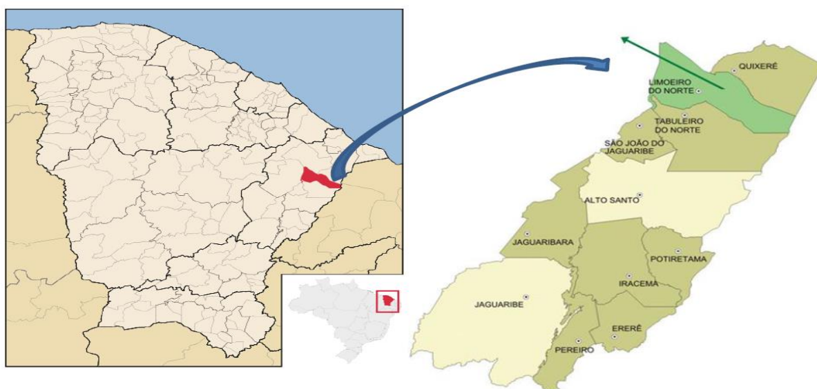
Figura 1–Localização do município de Limoeiro do Norte - CE.

Limoeiro do Norte (Figura 1), situado a 200 km da Capital, Fortaleza, inserida na microrregião do Baixo Jaguaribe, abrange a 25ª maior população do Estado, com 56.281 habitantes, área de 751,535 km 2 e densidade demográfica de 74,87 habitantes/km 2 . Desses, 32.502 habitantes (57,75%) residem no perímetro urbano, a Sede, habitando 11.058 domicílios - 57,43% do total (IBGE,2010).