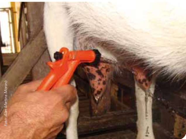
Lavagem das tetas com água clorada

A higiene da ordenha consiste na limpeza das tetas da cabra e das mãos do ordenhador, para evitar contaminações do úbere/mama, prevenindo a doença chamada mastite. A mastite, também conhecida como mamite, é a inflamação da glândula mamária. Quando a cabra está com mastite visível, o úbere estará quente, inchado, duro, vermelho e dolorido.