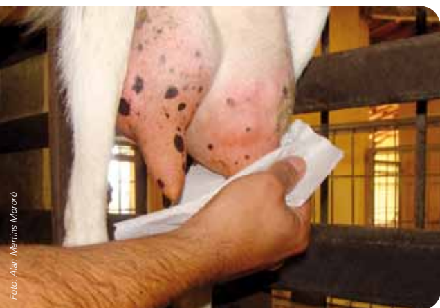
Secagem das tetas