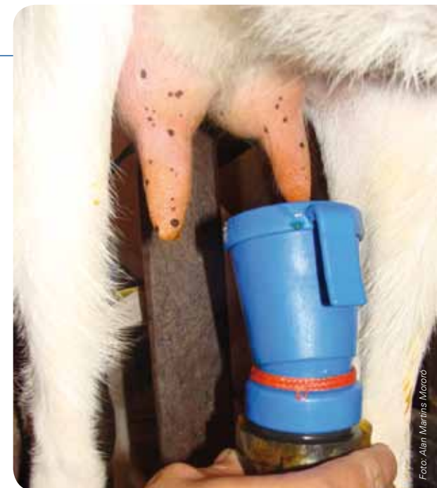
Antissepsia das tetas após a ordenha