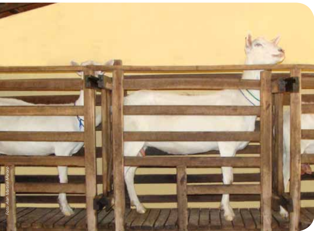
Linha de ordenha