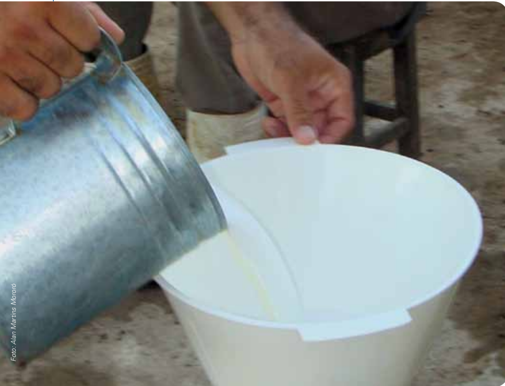
Filtração do leite