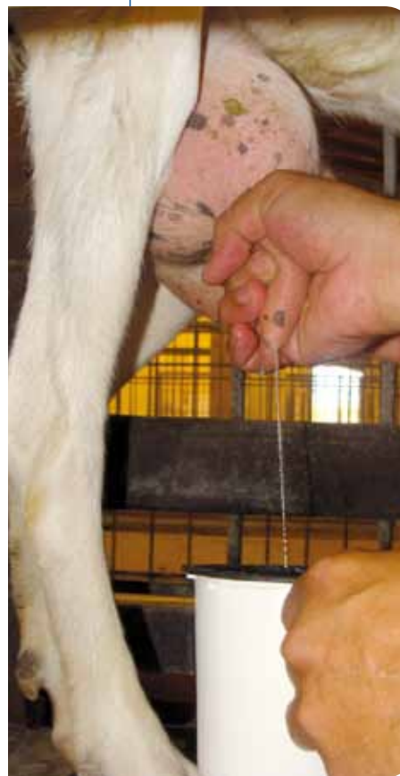
Teste da caneca telada