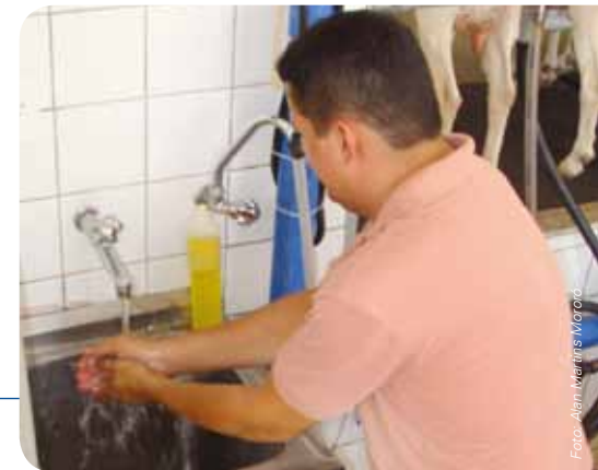
Ordenhador lavando as mãos