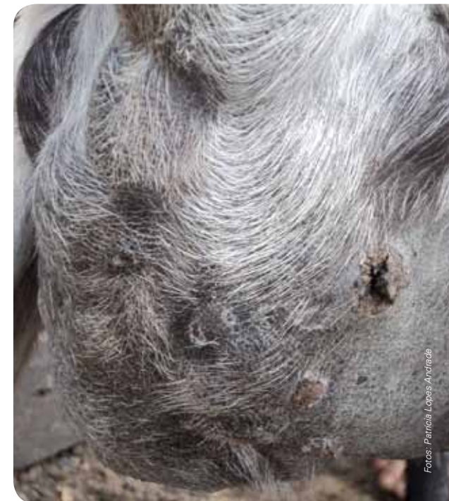
Cabra com inflamação/inchaço do úbere/mama e tetas.