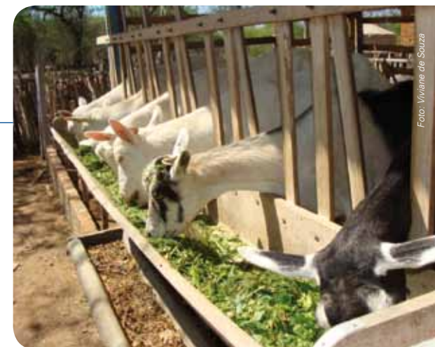
Manutenção dos animais de pé após a ordenha