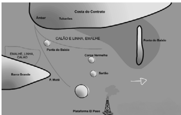
Figura 4 – Mapa mental dos pesqueiros frequentados pelos pescadores de Ilha do Contrato, município de Igrapiúna.

DRP durou, aproximadamente, trinta dias. Houve envolvimento direto das comunidades pesqueiras no conhecimento de sua situação atual e na discussão dos problemas e potencialidades. Portanto, os encontros em campo serviram de base para a geração de informações necessárias ao cumprimento do objetivo previamente acordado. Para isso, um conjunto de técnicas foi empregado para a coleta dos dados em campo, e foi baseado em manuais, tais como: Bunce et al. , 2000; Cordioli, 2001; Geilfus, 1997; FAO, 2001. Dentre as técnicas utilizadas em campo pela equipe, citam-se as principais: Entrevista Semiestruturada, Linha do tempo, Relógio de Rotina, Mapa Mental e Matriz de Avaliação. Um exemplo das técnicas utilizadas (Figura 4) ilustrou a riqueza de detalhes, no relato dos pescadores de Ilha do Contrato, sobre os principais pesqueiros e artes de pesca utilizadas. A riqueza de informações gerada é pouco observada em diagnósticos formais.