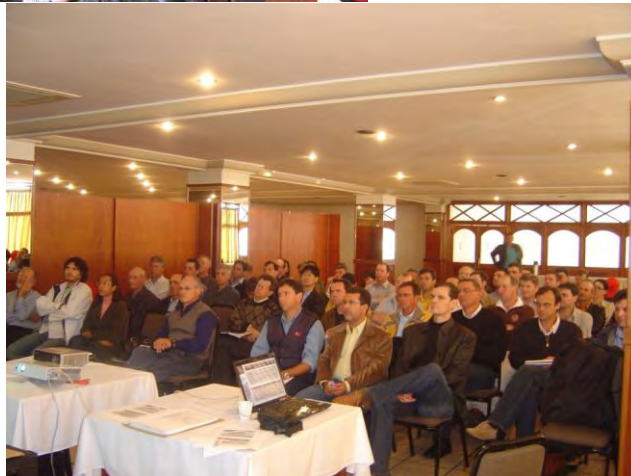
Figura 4. Reuniões Técnicas para divulgação dos resultados obtidos pelo Projeto INOVAMAÇÃ.