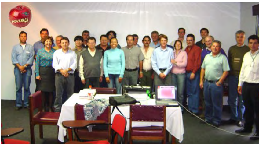
Figura 2. Equipe do Projeto INOVAMAÇÃ, reunida na primeira Reunião de Trabalho, realizada em 28/05/2008, em Lages SC.