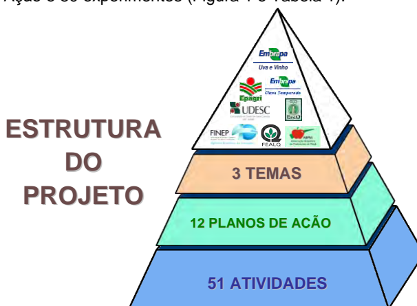
Figura 1. Estrutura do Projeto INOVAMAÇÃ.

O Projeto "Inovações Tecnológicas para a Modernização do Setor da Maçã" – INOVAMAÇÃ , iniciado em 2007, coordenado pela Embrapa Uva e Vinho, contou com uma equipe formada por mais de 30 pesquisadores de alta competência e experiência (Figura 2), vinculados às seguintes Instituições: Embrapa Uva e Vinho, Epagri, Embrapa Clima Temperado, UDESC e ESALQ, que atuam em pesquisa sobre maçã e sobre fruticultura. A execução financeira foi sob a responsabilidade da Fundação de Estudos Agrários Luiz de Queiroz (FEALQ), atuando, para tanto, articuladamente com a FINEP. O Projeto, estruturado em três Temas, envolveu 12 Planos de Ação e 50 experimentos (Figura 1 e Tabela 1).