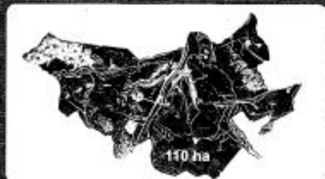
Distribuição de áreas totais do terreno

São inúmeras as possibilidades de novas ações de parceria entre a Embrapa Gado de Leite e a UFJF. O grande passo para esta ampliação está sendo dado na negociação de concessão mútua de áreas que viabilizará a ambas instituições a ampliação e diversificação necessária às novas demandas.