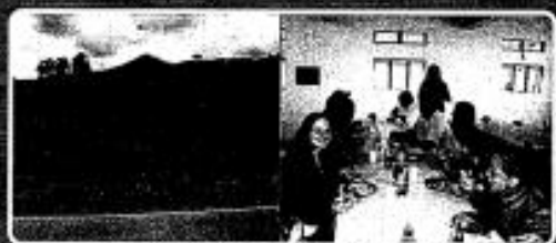
Vista parcial do terreno adjacente ao asfalto

Hospedaria, restaurante, internet (wireless), telefone, acesso à rodovia.