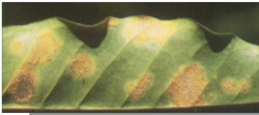
Fig. 9. Ferrugem do cafeeiro: urédias e télias.

Os sintomas iniciais da ferrugem alaranjada são manchas cloróticas translúcidas, de 1 a 3 mm de diâmetro, que aparecem na face inferior do limbo foliar e que, em poucos dias, atingem 1 a 2 cm de diâmetro, no interior das quais formam-se massas pulverulentas de coloração amarelo-laranja, os uredósporos do patógeno (Fig. 9).