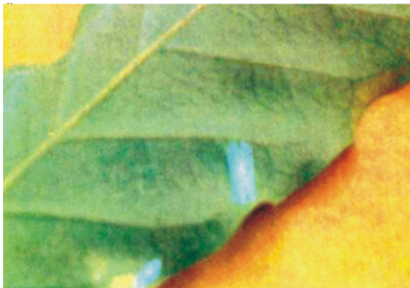
Fig. 6. Crisálida de bicho-mineiro.