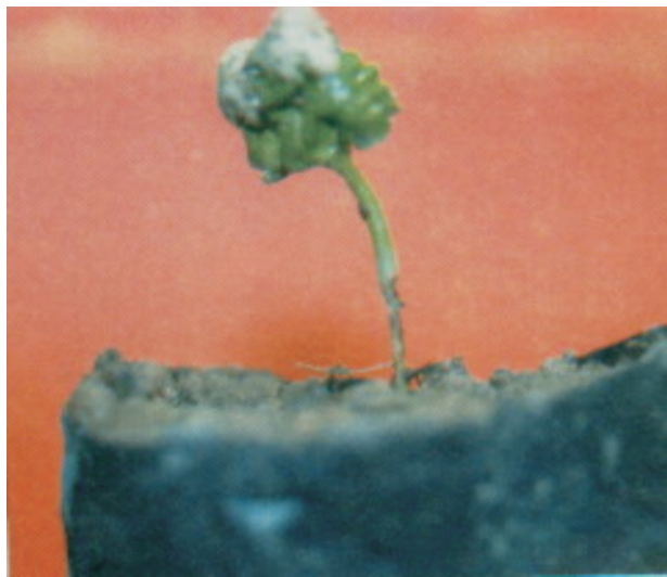
Fig. 7. Rhizoctoniose: plântula atacada na região do colo. Fonte: Veneziano (1996).