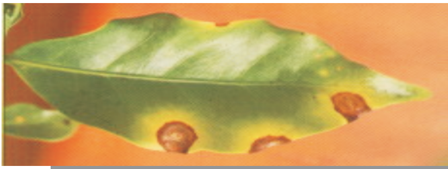
Fig. 10. Mancha de cercospora: lesões marrom-escuras com centro acinzentado.