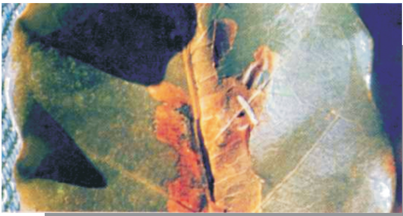
Fig. 4. Lesão e larvas do bicho-mineiro.

Pode ocorrer durante o ano todo, especialmente nos períodos secos, em lavouras de qualquer idade (Fig. 4 e 5). Na face inferior das folhas da região mais baixa da planta, tecem um casulo como fios de seda em formato de “X”(Fig. 6).