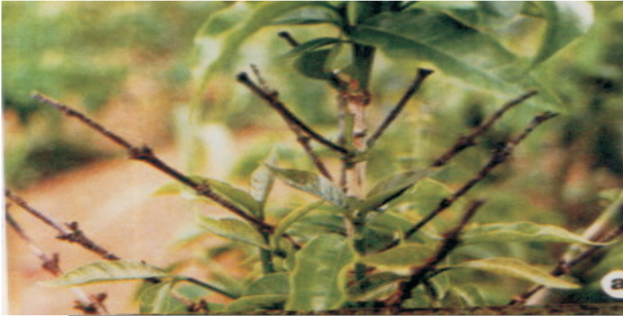
Fig. 11. Seca dos ponteiros de origem biótica ( Colletotrichum coffeanum ): aspecto geral da planta de cafeeiro atacada.