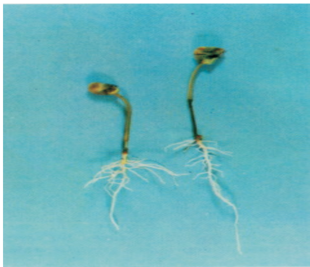
Fig. 8. Rhizoctoniose: plântulas atacadas na fase orelha-de-onça.