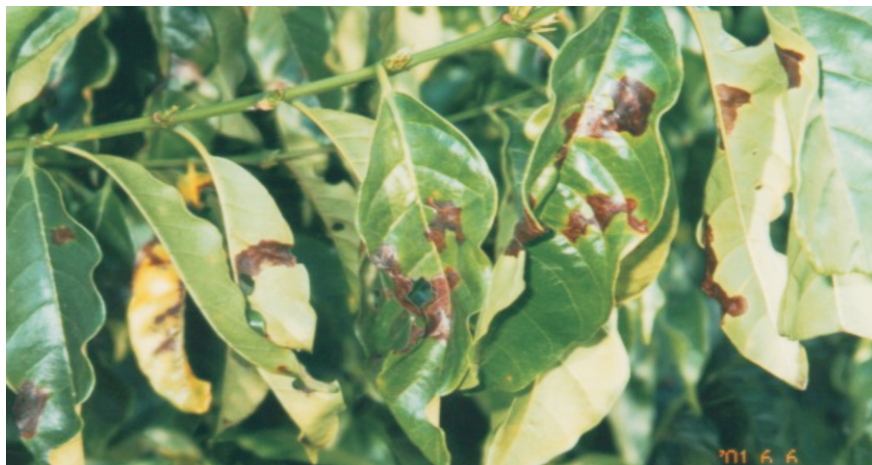
Fig. 5. Sintomas de ataque do bicho-mineiro.