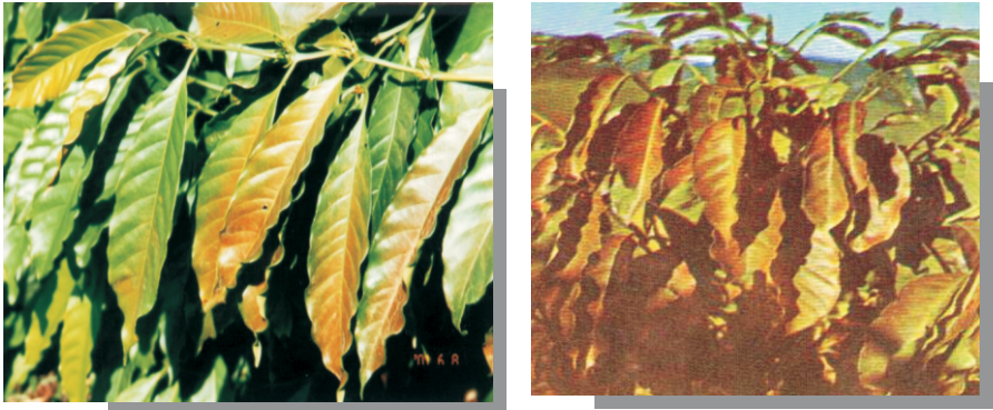
Fig. 3. Sintomas de ataque do ácaro-vermelho no cafeeiro.